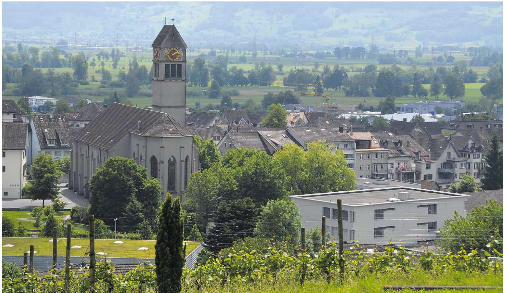
Attraktiv, aber nicht nur: Die hohe Steuerbelastung in Uznach sorgt bei den Bürgern zunehmend für Unmut.